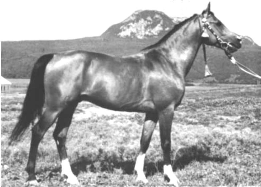
Foto: Vollblutaraber Arax ox

Begegnet man einem Pferd der Tersker Rasse, so wird man zunächst vermuten, einen Araber vor sich zu haben. Und dabei liegt man nicht einmal weit daneben. Einzig Größe, Kaliber und der metallische Glanz im silberweißen Fell (oder auch im kupferfarbenen) deuten vielleicht darauf hin, daß es sich hierbei nicht um einen Vollblutaraber handelt.